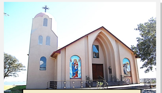
St. Mary & St. Moses Abbey, TX