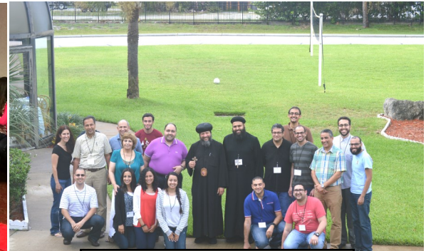
ASAPH Hymns Institute Convention