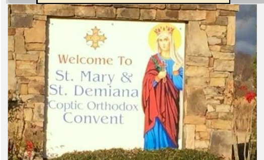
St. Mary & St. Demiana Convent & Retreat Center, GA