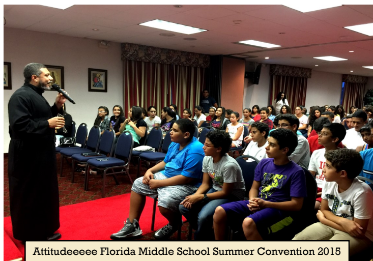
Attitudeeeee Florida Middle School Summer Convention 2015

St. Verena Resource Ministry (SVRM) Professionals networking together to make a difference and provide resources to our Coptic community. Make a request or volunteer as a consultant.