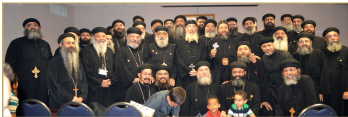
المؤتمر السنوى لعائلات الكهنة