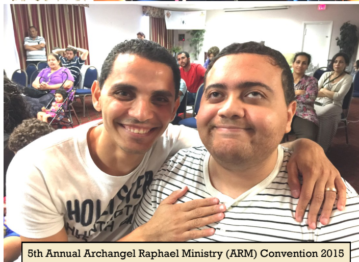
5th Annual Archangel Raphael Ministry (ARM) Convention 2015