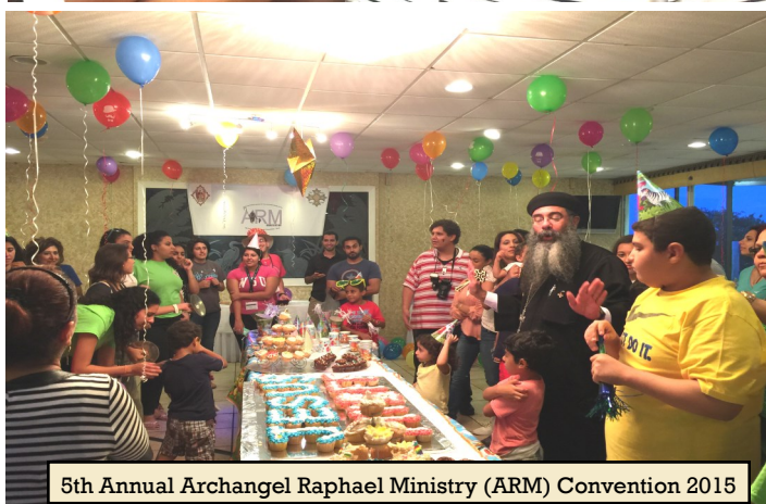
5th Annual Archangel Raphael Ministry (ARM) Convention 2015