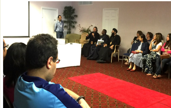
Coptic Truth Conference (CTC) Evangelism & Apologetics