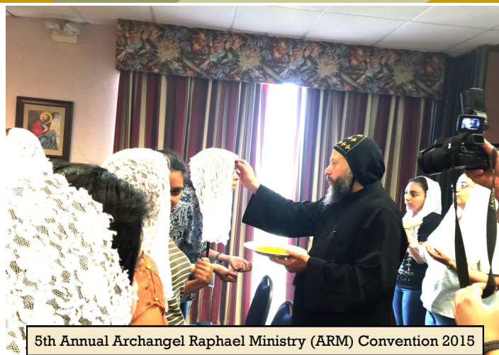
5th Annual Archangel Raphael Ministry (ARM) Convention 2015