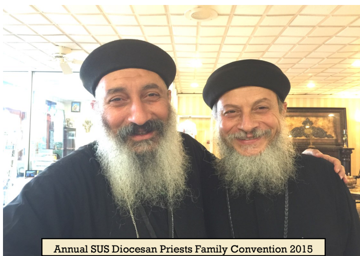
Annual SUS Diocesan Priests Family Convention 2015